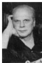
PHILIP JOSÉ FARMER

A Vuestros Cuerpos Dispersos (Comentario de la contraportada)